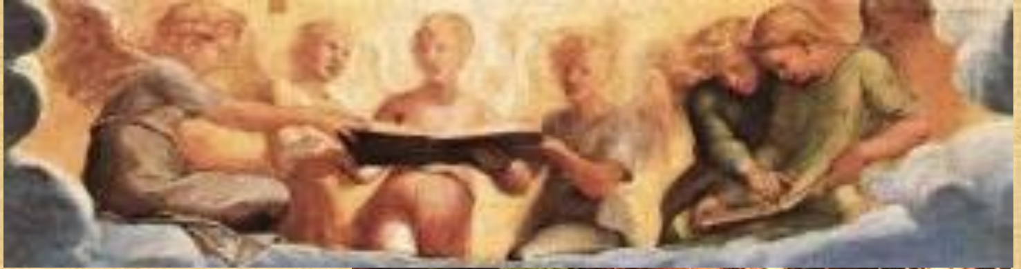
Estasi di Santa Cecilia Raffaello e altri (1514/16) Pinacoteca Nazionale Bologna