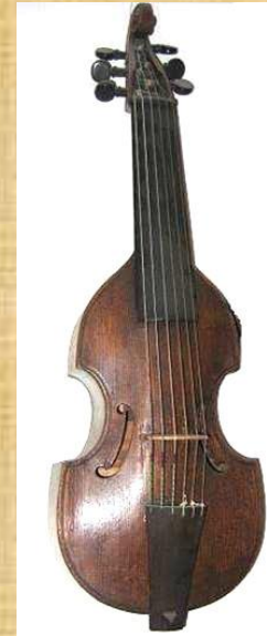
VIOLA DA GAMBA